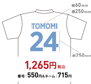
公式戦対応マーキング